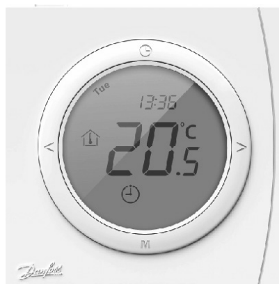
ECtemp Next Plus

Všechny pokojové termostaty jsou používány pro regulaci teploty v místnosti v systémech elektrického podlahového vytápění. Regulací teploty v místnosti podle požadavků uživatele, poskytují pokojové termostaty optimální úsporu energie při zachování optimální tepelné pohody v místnosti.